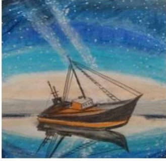
P. Srilakshmi, III CSE-B