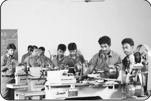
లేత్ ఆపరేటర్ (Lathe Operator)

మొత్తం ఖాళీల సంఖ్య - 25, అర్హత : 8వ తరగతి పాస్