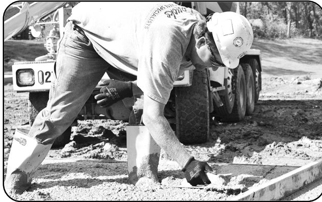
బేల్టారి (Mason Concrete)

మొత్తం ఖాళీల సంఖ్య - 25, అర్హత : 5వ తరగతి పాస్