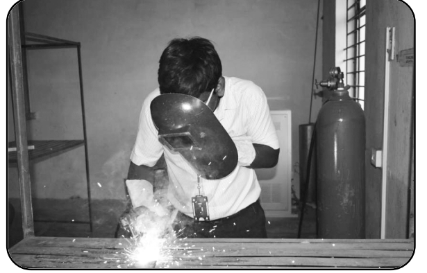
వెల్డింగ్ ఆపరేటర్ (Welding Operator)

మొత్తం ఖాళీల సంఖ్య - 25, అర్హత : 8వ తరగతి పాస్